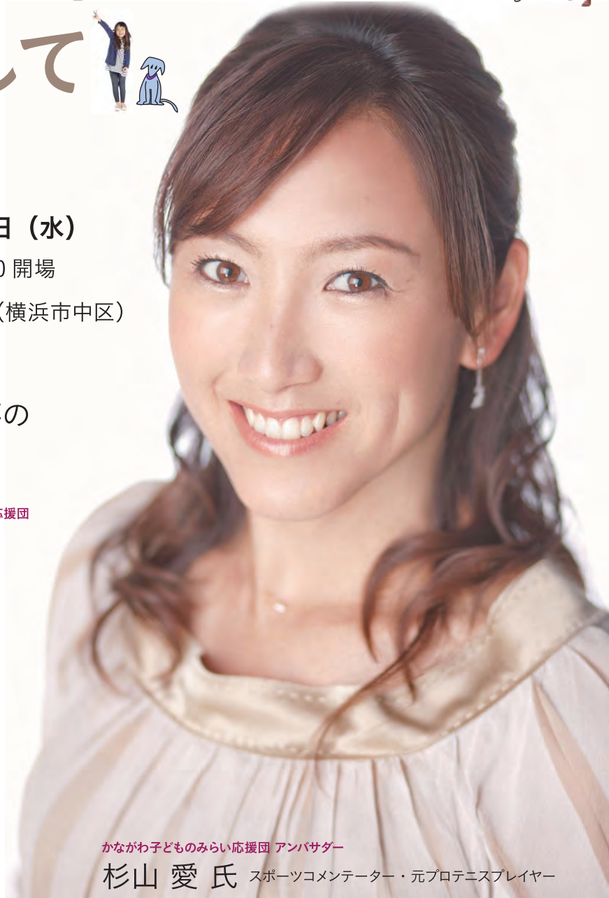
かながわ子どものみらい応援団 アンバサダー 杉山 愛氏 スポーツコメンテーター・元プロテニスプレイヤー

対象 子ども・青少年の支援者、NPO・企業、自治体関係者、関心のある県民の方など