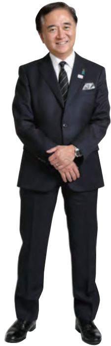
かながわ子どものみらい応援団 団長 黒岩 祐治 神奈川県知事